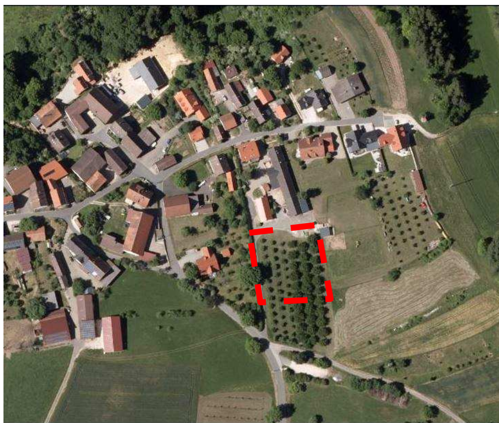
Abb. 4: Luftbild mit Darstellung der Bestandssituation (Geltungsbereich rot gestrichelt dargestellt, Abgrenzung schematisch, Darstellung genordet, o. M., Quelle: „Bayern Atlas Plus“)

Die derzeitige Bestandssituation ist der nachfolgenden Abbildung 4 zu entnehmen.