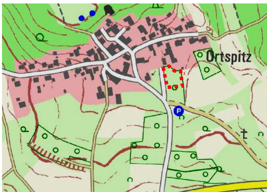
Abb. 2: Lage des Plangebietes im Ortsteil Ortspitz (Lage des Plangebietes mit rot gestrichelter Linie markiert, Ausschnitt aus der Topographischen Karte, M 1 : 10.000, Darstellung genodet, o. M.)